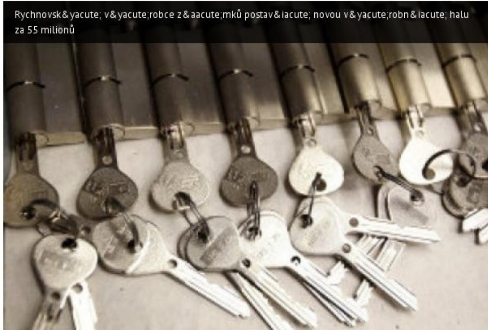
Rychnovská společnost vyrobí přes osm milionů zámků ročně. Ty míří hlavně na export. Značka FAB tvoří pětinu produkce.

"Jsme vnímání jako jedna z nejlepších firem v rámci celé skupiny, takže tato změna nepřichází jen tak sama od sebe," komentuje Galda. Centrála do východočeské společnosti už dříve přesunula výrobu z ostatních zemí koncernu – Izraele, Francie a Švýcarska.